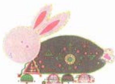
good Ketambe Obbe©

アスベストに限らず、雇用者に対して労 働者の安全に十分配慮するよう求めるこ と、メーカーに対して製品についての安全確 保を求めること、国などに対して国民の生 命身体の安全を実現する政策を求めるこ と、そして、万が一にも被害が生じたとき はその賠償等を求めて被害回復を図って いくこと。これらは私たち弁護士の重要な使 命であり、ちくし法律事務所弁護士た ちも積極的に携わってきた分野です。私た ちは、自らの使命を忘れることなく、これ からも日々研鑽に努めてまいります。