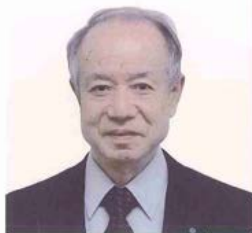
誠愛リハビリテーション病院 名誉院長