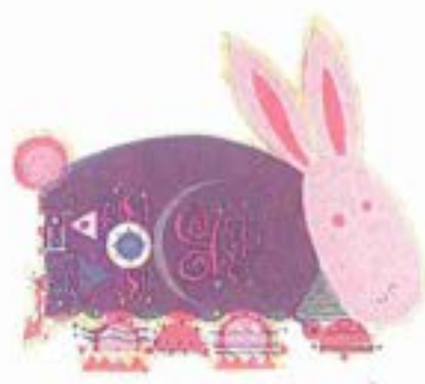
very Keisuke Ooba ©

あと1、2年もすれば、「ブルーレイ」を何のためらいもなく裁判所に提出できる日が来るのかもしれない。(今はまだ、裁判所に「(機器がなく)見られませぬ」と言われる気がします。)